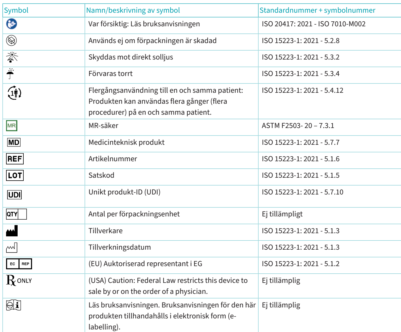
Tab. 1: Förklaring av symboler